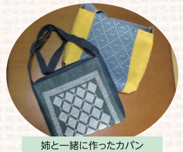
姉と一緒に作ったカバン

転居及び氏名変更、お亡くなりになられた場合は組織部(電話76215888)までご連絡ください。 ※本紙は一世帯に一部お届けしています。一部届いている方はお知らせ願います。