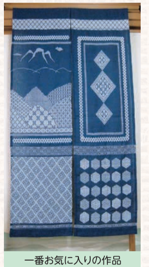
一番お気に入りの作品