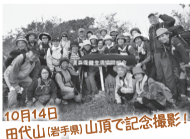
10月14日 田代山(岩手県)山頂で記念撮影!

私の話はだいたい固い話が多いのですが、今回は趣向を変えて私の趣味について。皆さん、いろいろな趣味をお持ちとは思いますが、年齢と共に変わる趣味もあれば、全く変わらない趣味もあるでしょう。私にも質や量は大きく変わりましたが、数十年来持ち続けている趣味がいくつかあります。その一つは山歩き。登山というほど大げさなものではなく、ゆつくりと木々の緑や花、山の景色、雲や空を眺め、山頂や稜線にてお弁当を楽しむ、時には湧水を楽しむといった山歩きです。一時中断していましたが、当保健生協60周年記念登山が