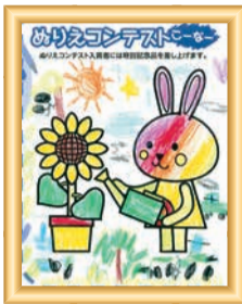
陸さん(3才) 呉竹幼稚園