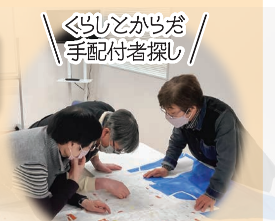
くらしとからだ 手配付者探し