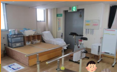
機能訓練コーナー