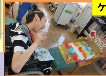
ケーキ作りゲーム♪