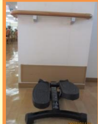
サイドステッパー