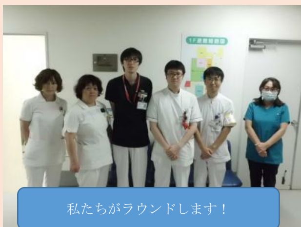
私たちがラウンドします！

ゴミの廃棄には多額処理費がかかっているため、スタッフの皆さんと一緒に取り組みことで、コスト削減を図るきっかけになればいいなと思っています。