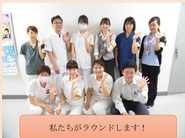
私たちがラウンドします！

手指衛生は、どんな感染対策より重要な効果的な行為です。みなさんと一緒に取り組んでいきます！