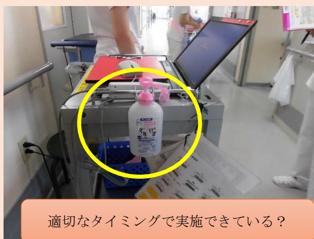
適切なタイミングで実施できている？