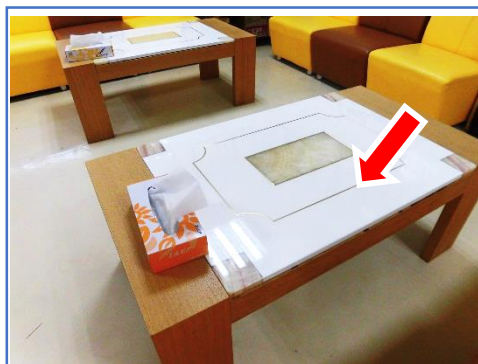
① 談話室のテーブル