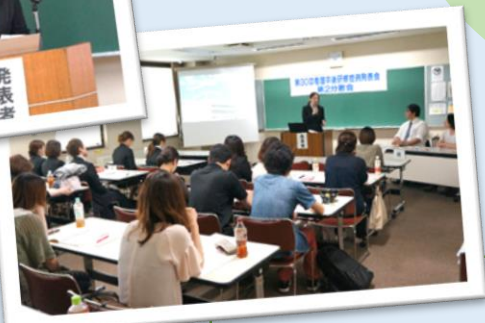
県連卒後研修症例発表会