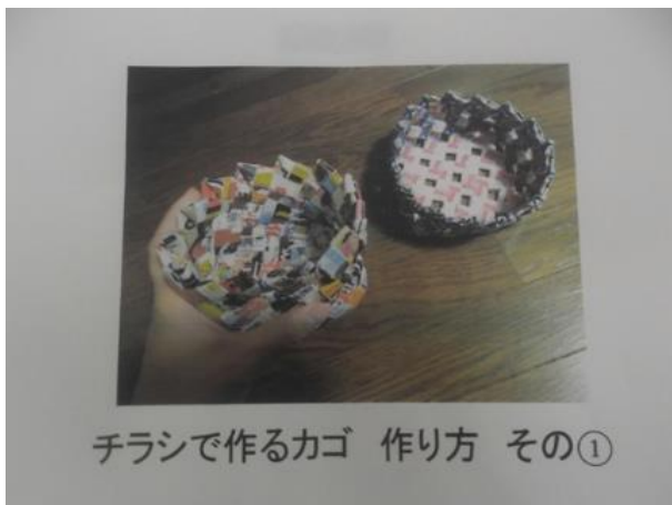
チラシで作るカゴ 作り方 その①

2018年8月31日上記講習会へ参加したスタッフからの伝達学習会がありました。参加者は17名。