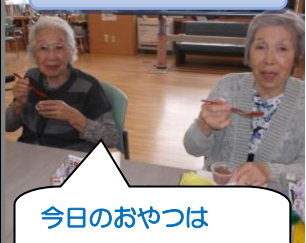
午後のおやつタイム

餃子の皮で作ったピザとスイーツ！好みのトッピングをのせて、ホットプレートで焼きました。とろ〜りチーズとパリパリに焼けた皮が美味しく、好評でした(^o^)b