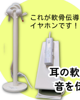
これが軟骨伝導イヤホンです！