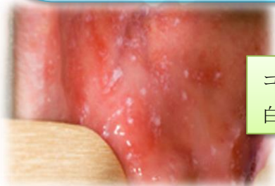
コプリック斑 白いプツプツ