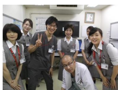
循環器研修を終えて、 中部クリニックの 診療所研修へ！