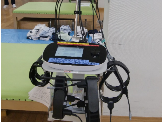
G-TES(ジーテス)の全体像です。

9月28日にPT学習会でG-TES(ベルト電極式骨格筋電気刺激装置)の操作・装着について行いました。