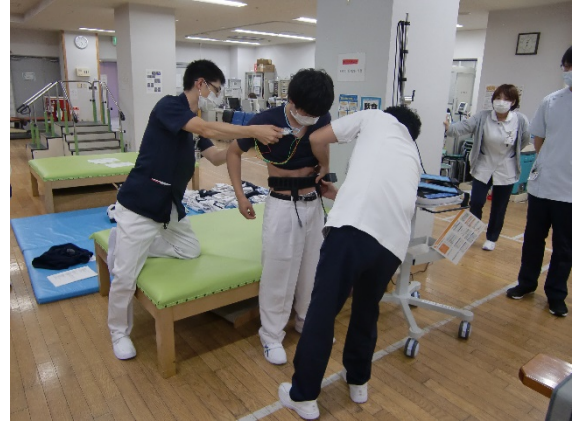
装着は難しくないとのことでした。